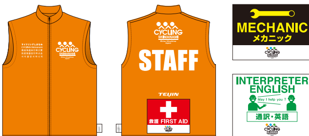
一般スタッフユニフォーム

大会では、約2,500人のスタッフが大会運営にあたっています。スタッフは下のようなスタッフウェアを着ていますので、必要なことがあればお声掛けください。