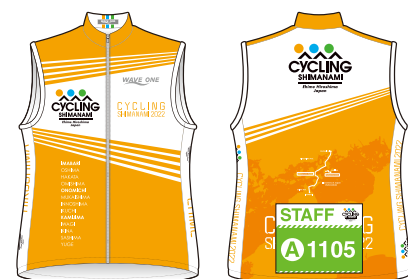
ボランティア走行スタッフユニフォーム

大会当日はコース誘導や完走サポートのために地元サイクリストのボランティアスタッフが参加者と一緒に自転車で走行します。状況によっては注意喚起や指示を行うことがありますので従ってください。参加者自身で対処できないトラブルなど、必要な場合はボランティア走行スタッフに声を掛けてください。