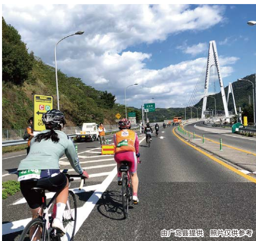
照片仅供参考