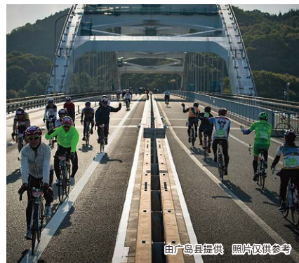
照片仅供参考