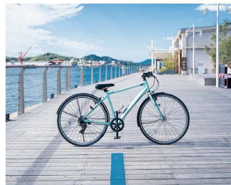
山地自行车的例子