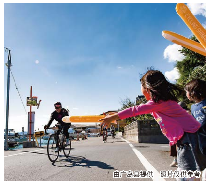
照片仅供参考