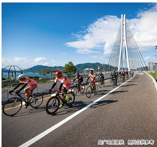
照片仅供参考

※参加者需为高中生或其以上，可独立完成骑行， 有参加过与本次路线距离相近的骑行活动并骑完全程者