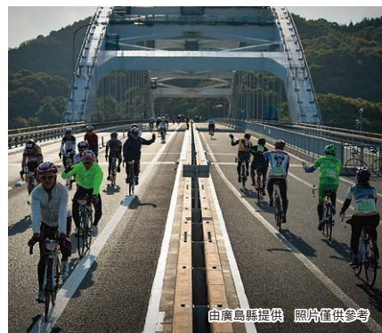
照片僅供參考