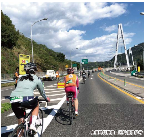
照片僅供參考