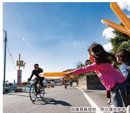
由廣島縣提供 照片僅供參考

「瀨戶內島波海道」在 2019 年 11 月被日本政府指定為「國家自行車道」。這是個以這條代表日本、名譽世界的自行車道為舞台、招攬海內外 7000 名參加者舉辦國際自行車大會。活動中可騎車橫渡平靜美麗、小島點在、風光明媚瀨戶內海上的島波海道自行車道、這裡同時也是聞名世界的「自行車聖地」。