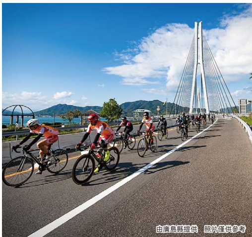
照片僅供參考