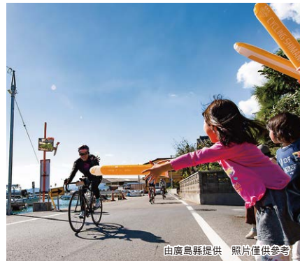
由廣島縣提供 照片僅供參考

「瀨戶內島波海道」在 2019 年 11 月被日本政府指定為「國家自行車道」。這是個以這條代表日本、名譽世界的自行車道為舞台、招攬海內外 7000 名參加者舉辦國際自行車大會。活動中可騎車橫渡平靜美麗、小島點在、風光明媚瀨戶內海上的島波海道自行車道、這裡同時也是聞名世界的「自行車聖地」。